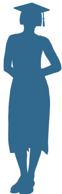
Moeite met behalen startkwalificatie