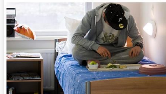
Weinig oog voor laag IQ.