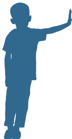
Problemen op school